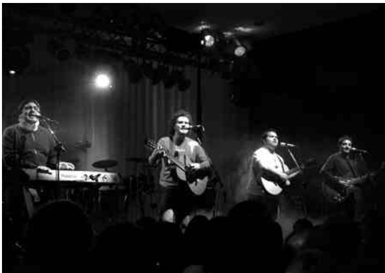
Los Huayra le pusieron folklore a la primera noche de la ExpoVino.

Al cierre de esta edición subían al escenario de la ExpoVino los jujeños de Los Tekis para armar un gran carnaval