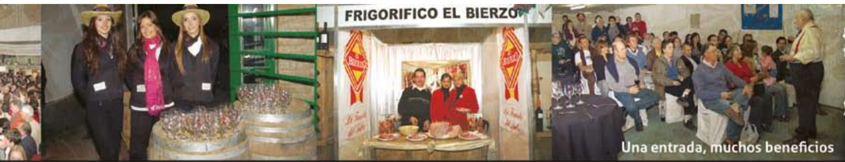
Una entrada, muchos beneficios